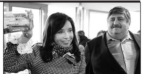
El burócrata del Smata es parte del "modelo sindical" K

El 22 de julio pasado se realizó una conferencia de prensa en el Congreso Nacional por parte de los trabajadores de Lear, abogados, organismos de derechos humanos y organizaciones políticas que apoyamos esta lucha. Allí se acordó presentar una denuncia penal contra Pignanelli (Smata), por la fraudulenta asamblea que realizó días pasados obligando a los trabajadores, mediante coacción, a que firmen un acta ilegal para despedir a la comisión interna. La multinacional fue emplazada a restituirla por seis fallos judiciales.