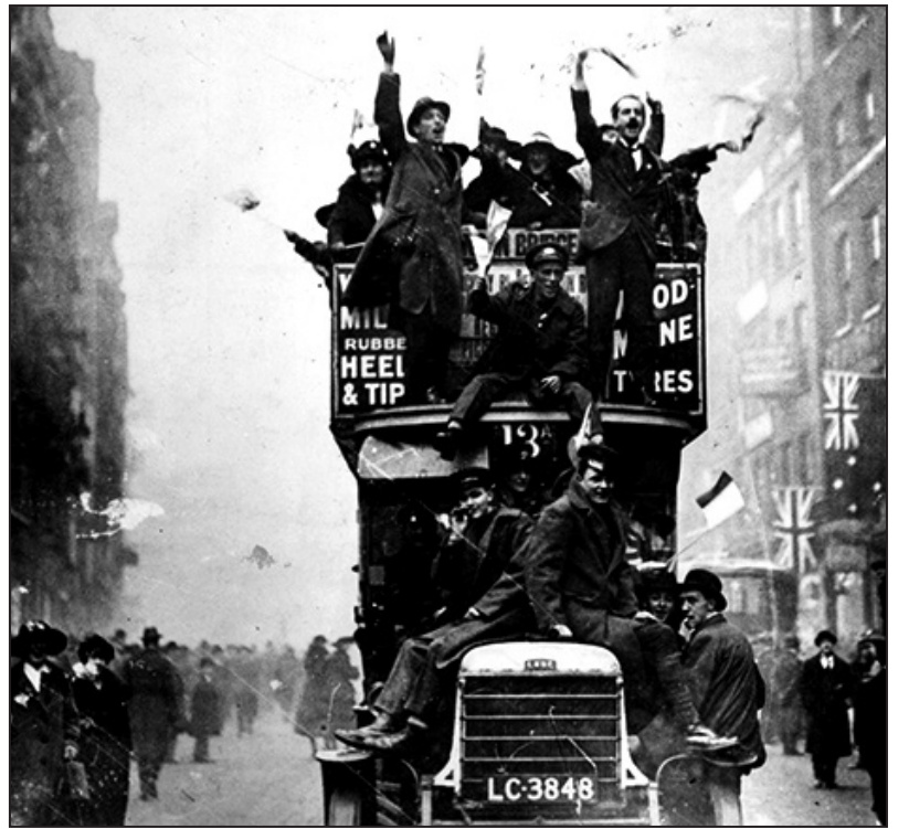
Festejos en Londres por el fin de la guerra. Noviembre 1918

Reforzados por las tropas provenientes del frente este, los alemanes ponen todas sus fuerzas en la ofensiva a partir de marzo de 1918. Pero, mal alimentadas y cansadas, las tropas alemanas no pudieron resistir la contraofensiva de los aliados, ahora