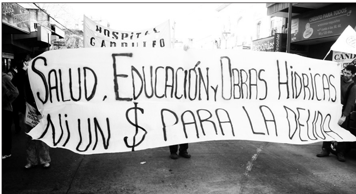
Por pagar, cada vez tenemos menos salud, educación, viviendas, salarios y jubilaciones

Dicho esto, el lector podrá decirnos: "está bien, estoy de acuerdo en que no hay que pagar"