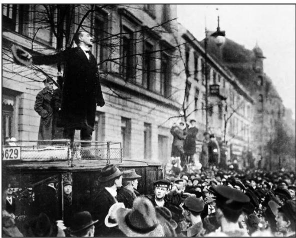
Karl Liebknecht. Enero de 1919. Berlín

Gracias a la traición de la socialdemocracia, primero se dio la guerra, y luego no triunfó esta oleada revolucionaria que podría haber impuesto un nuevo mundo socialista. La URSS quedó aislada y se instaló la época del imperialismo, con nuevas guerras y revoluciones.