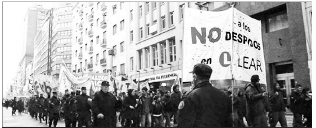
Marcha unitaria de los trabajadores de Lear junto a distintas organizaciones al Ministerio de Trabajo de la Nación, miércoles 23 de julio

hizo una sola asamblea para apoyar el reclamo obrero. ¡Pero sí obligó a los trabajadores de Lear (acordando con la patronal que los retiraba de la fábrica en colectivos en horario de trabajo) a ir al Smata central y "votar" que le retiraban los fueros al cuerpo de delegados! Así quiere ayudar a que el Ministerio de Trabajo pueda justificar que la patronal despida a los delegados. Además de los cortes y bloqueos en la puerta de la empresa, se hizo una movilización al Ministerio de Trabajo, donde participaron diferentes organizaciones sindicales, entre ellas el Encuentro Sindical Combativo, y partidos políticos, con fuerte presencia del Frente de Izquierda. Además, se realizó una conferencia de prensa